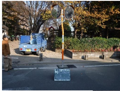
カーブミラーの柱にも設置(幅は特注になっています)