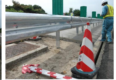
ガードレールへの設置状況