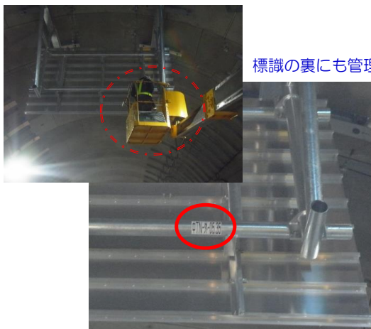
標識の裏にも管理番号