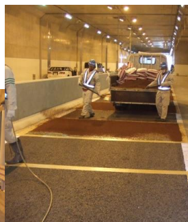
下り坂にすべり止め