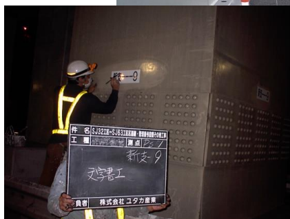
橋脚管理番号(シートではいけない)