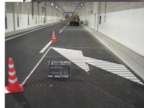
矢印を描く(見た目がよい...)